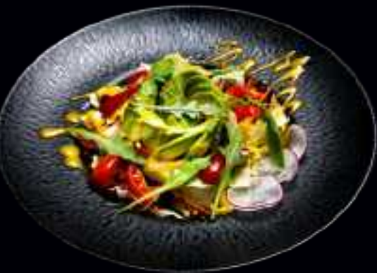
V7 MANGO-AVOCADO SALAT 8,00 GEMISCHTER SALAT MIT AVOCADO UND MANGO IN FEINER MANGO SAUCE, GARNIERT MIT GRANATAPFEL UND ERDNÜSSEN