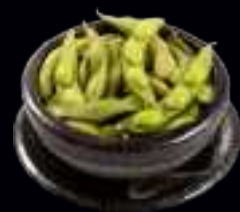
V5 EDAMAME | STÄNGELBOHNEN, GARNIERT MIT SALZ 6,00