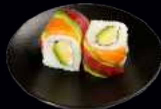
402 RAINBOW ROLLS 8,50

MANGO, AVOCADO UND FRISCHKÄSE, UMMANTELT MIT AVOCADO (4 Stk)