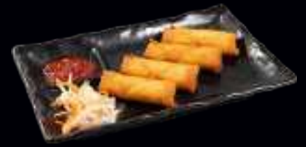
V10 FRÜHLINGSROLLEN 4,00 MIT GEMÜSE GEFÜLLTE TEIGTASCHEN (4 Stk)