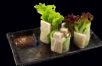
V15 SOMMERROLLE TOFU 7,00 IN FRISCHEM REISPAPIER EINGEROLLT, MIT REIS, KRÄUTERN UND SALAT