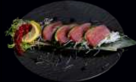
506 SASHIMI SAKE SMALL 10,00

4x SCHEIBEN PURES LACHSFILET, GARNIERT MIT WEIßEM RETTICH, LIMETTEN UND WILDKRÄUTERSALAT