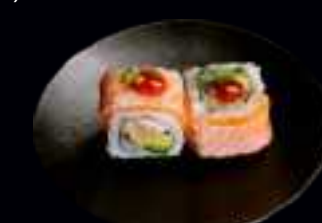
416 GEISHA ROLLS 11,00

KNUSPRIGE GARNELE MIT MANGO, SPARGEL, UMMANTELT MIT FLAMBIERTEM LACHSFILET, GARNIERT MIT TRÜFFEL-MAYO (4 Stk)