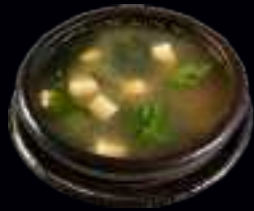
V1 MISO SUPPE | TOFUSTÜCKE UND SEETANG 5,50