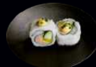
412 TUNA ITALIANO ROLLS 9,00

AVOCADO UND FRISCHKÄSE, UMMANTELT MIT THUNFISCHFILET (4 Stk)