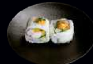
409 SPICY EBI ROLLS 8,50

GEKOCHTE GARNELE, GURKE, RETTICH, SCHNITTLAUCH UND SCHARFE JAPANISCHE MAYONNAISE (4 Stk)