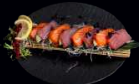
509 SASHIMI TUNA BIG 24,00

8x SCHEIBEN PURES LACHSFILET, GARNIERT MIT WEIßEM RETTICH, LIMETTEN UND WILDKRÄUTERSALAT