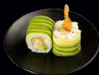
405 SWEET EBI ROLLS 10,00

KNUSPRIGE GARNELE MIT RETTICH, GURKE, MAYONNAISE, GARNIERT MIT SEETANG UND SESAM (4 Stk)