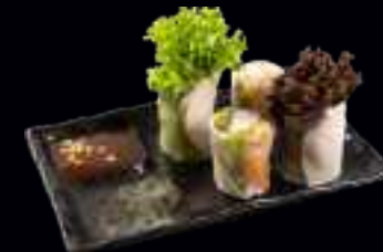
V11 SOMMERROLLE HUHN 7,00 IN FRISCHEM REISPAPIER EINGEROLLT, MIT REIS, KRÄUTERN UND SALAT