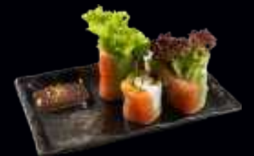
V13 SOMMERROLLE LACHS 8,00 IN FRISCHEM REISPAPIER EINGEROLLT, MIT REIS, KRÄUTERN UND SALAT