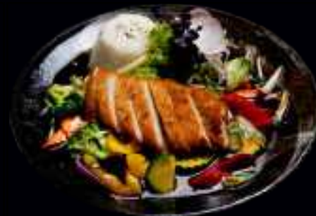
W5 GEBACKENES HÄHNCHENBRUSTFILET TERIYAKI 15,00

GEBRATENES HÜHNERFLEISCH MIT VERSCHIEDENEM GEMÜSE, REIS UND CURRY SAUCE