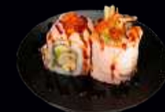
414 KAWA EBI ROLLS 11,00

FRITTIERTE LACHSHAUT, MANGO, AVOCADO, MAYONNAISE, UMMANTELT MIT FLAMBIERTEM LACHS, GARNIERT MIT LACHSKAVIAR UND TERIYAKI SAUCE (4 Stk)