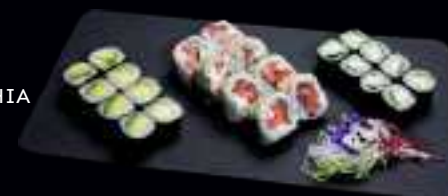
702 MENÜ 2