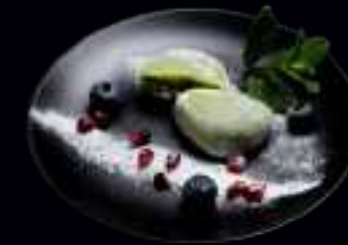
N1 JAPANISCHER REISKUCHEN 4,00

TRADITIONELLER JAPANISCHER REISKUCHEN AUS KLEBREIS. GESCHMACKSRICHTUNGEN: MANGO / ERDBEERE / GRÜNER TEE / SESAM