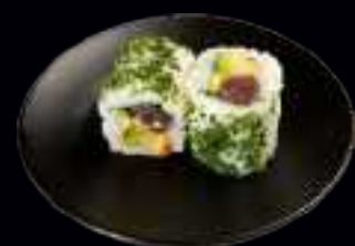
408 SPICY TUNA ROLLS 8,50

LACHS MIT AVOCADO, SCHNITTLAUCH UND SCHARFER JAPANISCHER MAYONNAISE (4 Stk)