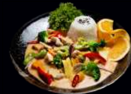
W4 HÜHNERFLEISCH CURRY 13,50

GEBRATENES HÜHNERFLEISCH MIT VERSCHIEDENEM GEMÜSE, REIS UND TERIYAKI SAUCE