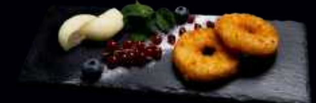
N4 GEBACKENER APFEL 7,00

GEBACKENE BANANE MIT HONIG UND EINEM MOCHI-EIS NACH WAHL: VANILLE / MANGO / KOKOS / SCHOKO