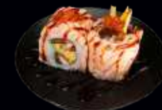
413 KAWA SALMON SKIN ROLLS 10,00

GEKOCHTER THUNFISCH, GURKE, RETTICH, RUCOLA UND MAYONNAISE, GARNIERT MIT TRÜFFEL-MAYO SAUCE UND SCHNITTLAUCH (4 Stk)