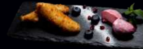
N3 GEBACKENE BANANE 7,00

ZARTER JAPANISCHER REISKUCHEN MIT CREMIGER EISFÜLLUNG. GESCHMACKSRICHTUNGEN: MANGO / KOKOS / SCHOKO / MATCHA