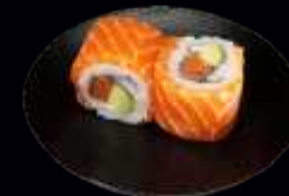
410 SAKE SPECIAL ROLLS 9,50

GEKOCHTE GARNELE, GURKE, RETTICH, SCHNITTLAUCH UND SCHARFE JAPANISCHE MAYONNAISE (4 Stk)