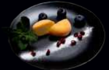
N2 MOCHI EIS 4,00

TRADITIONELLER JAPANISCHER REISKUCHEN AUS KLEBREIS. GESCHMACKSRICHTUNGEN: MANGO / ERDBEERE / GRÜNER TEE / SESAM