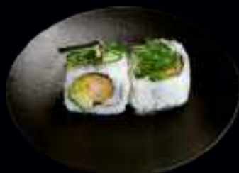
404 EBI SPECIAL 9,50

MANGO, AVOCADO UND FRISCHKÄSE, UMMANTELT MIT FLUSSAAL UND AVOCADO, TERIYAKI SAUCE UND SESAM (4 Stk)