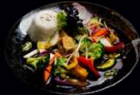
W1 TOFU TERIYAKI 12,00

GEBRATENER EDEL TOFU MIT VERSCHIEDENEM GEMÜSE, REIS UND TERIYAKI SAUCE