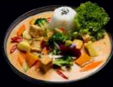
W2 TOFU CURRY 12,00

GEBRATENER EDEL TOFU MIT VERSCHIEDENEM GEMÜSE, REIS UND TERIYAKI SAUCE