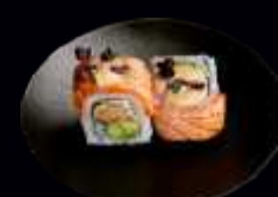
415 TIGER ROLLS 11,00

KNUSPRIGE GARNELE, MANGO, AVOCADO, MAYONNAISE, UMMANTELT MIT FLAMBIERTEM LACHSFILET, MIT LACHSKAVIAR, TERIYAKI SAUCE (4 Stk)