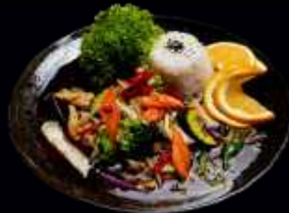
W3 HÜHNERFLEISCH TERIYAKI 13,50

GEBRATENER EDEL TOFU MIT VERSCHIEDENEM GEMÜSE, REISE UND CURRY SAUCE