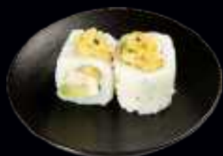
406 SWEET CHICKEN 7,50

KNUSPRIGE GARNELE MIT MANGO, AVOCADO UND FRISCHKÄSE, UMMANTELT MIT AVOCADO (4 Stk)