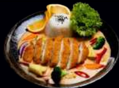
W6 GEBACKENES HÄHNCHENBRUSTFILET CURRY 15,00

PANIERTES HÄHNCHENBRUSTFILET MIT VERSCHIEDENEM GEMÜSE, REIS UND TERIYAKI SAUCE