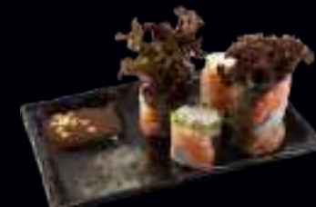
V12 SOMMERROLLE GARNELEN 8,00 IN FRISCHEM REISPAPIER EINGEROLLT, MIT REIS, KRÄUTERN UND SALAT