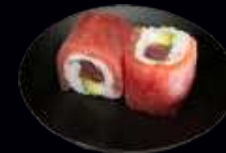
411 TUNA SPECIAL ROLLS 10,00

AVOCADO UND FRISCHKÄSE, UMMANTELT MIT LACHSFILET (4 Stk)