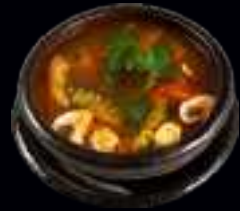
V2 FISCH SUPPE | LACHSFILET UND GEMÜSE (SCHARF) 6,00