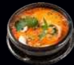
V6 GARNELEN SUPPE | CURRY UND KOKOS (SCHARF) 7,50