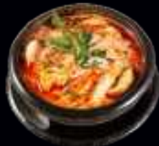
V4 HÜHNERFLEISCH SUPPE | CURRY UND KOKOS (SCHARF) 6,50