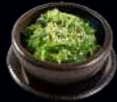
V3 WAKAME SALAT | SEETANG MIT SESAM 5,50