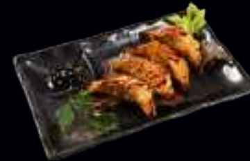
V9 GYOZA CHICKEN 6,00 GEBACKENE TEIGTASCHEN MIT HÜHNERFLEISCH (4 Stk)