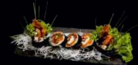
417 SAMURAI ROLLS 17,00

KNUSPRIGE GARNELE MIT AVOCADO, FRISCHKÄSE, UMMANTELT MIT FLAMBIERTEM LACHSFILET UND SWEET-CHILI SAUCE (SCHARF) (4 Stk)