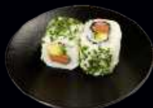
407 SPICY SAKE ROLLS 8,00

KNUSPRIGES HÄHNCHEN, MANGO, AVOCADO UND FRISCHKÄSE, GARNIERT MIT AVOCADO-MANGO UND TERIYAKI SAUCE (4 Stk)