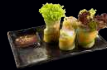
V14 SOMMERROLLE AVOCADO 7,00 IN FRISCHEM REISPAPIER EINGEROLLT, MIT REIS, KRÄUTERN UND SALAT