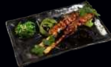
V8 SATÉ SPIEßE 5,50 HÜHNERFLEISCH MIT TERIYAKI SAUCE (2 Stk)