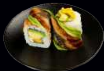
403 UNAGI SPECIAL 9,50

AVOCADO, FRISCHKÄSE, UMMANTELT MIT LACHS, THUNFISCH UND AVOCADO (4 Stk)